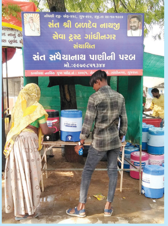
કાળજળ ઉનાળામાં પીવાના ઈડા પાણીની સેવા મોટુ પુષ્ક ગણાય છે અને એટલે જ ઠેર ઠેર પાણીની પરબ બંધાવવામાં આવે છે. સંતશ્રી બળદેવનાથજી સેવા ટ્રસ્ટ સંચાલિત સંત સંવેયાનાથ પાણીની પરબમાં નાગરિકોને મુસાફરો માટે પીવાના ઈડા પાણીની વ્યવસ્થા કરવામાં આવી છે.