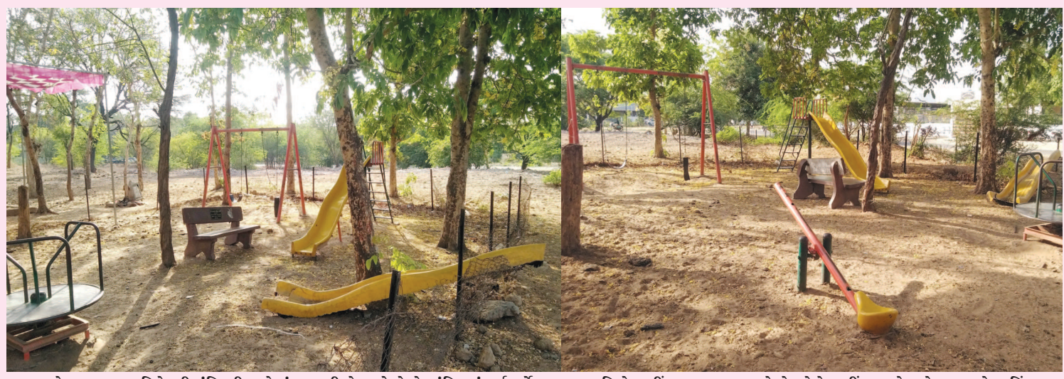
સેક્ટર-૪ ના શનિદેવની મંદિરની પાસે સુંદર બગીચો આવેલો છે. મંદિરમાં દર્શનાર્થે આવતા ભાવિકો અહીં હરવા-ફરવા આવે છે. જો કે અહીં બાળકો માટે લગાવવાયેલા હિંચકા, લપસણી અને અન્ય રમતગમતના સાધનો તુટેલી હાલતમાં જોવા મળી રહ્યા છે. બાળકોના રમતગમતના સાધનોનું રીપેરીંગ થવુ આવશ્યક છે.

બેટા તુ નાહકનો લગ્ન કરવાથી ડેર છે... આ બે... વાસણ માંજવામાં પંદર મિનિટથી વધુ સમય નથી જતો...!!