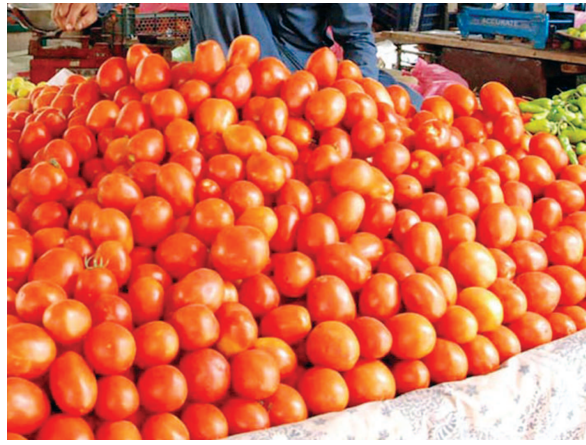
ટામેટાનો ભાવ ૮૦ રૂપિયા પ્રતિ કિલો સુધી પહોંચી ગયો છે. ટામેટા ઉપરાંત બટાટા, આદુ, મરચાં અને કોચમીરના ભાવમાં પણ ઉછાળો આવ્યો છે. હવામાનની બદલાયેલી સ્થિતિ અને વરસાદના કારણે ટામેટાના સપ્લાયને અસર થઈ છે અને ઘણો માલ બગડી ગયો છે.

વાસ્તવમાં એવા ઘણા કારણો છે, જેના કારણે ટામેટાના ભાવમાં વધારો થયો છે. પહેલું કારણ તાપમાનમાં વધારો છે. દેશના ઘણા રાજ્યોમાં છેલ્લા કેટલાક દિવસોથી ખૂબ જ ગરમી પડી રહી છે. બીજું કારણ એ છે કે, આ વખતે ટામેટાનું ઉત્પાદન ખૂબ જ ઓછા પ્રમાણમાં થયું છે. ટામેટાં ઓછા અને માંગ વધારે છે. ત્રીજું અને સૌથી મોટું કારણ વરસાદનું મોડું આગમન છે. આવા કેટલાક કારણોસર ટામેટાના ભાવમાં અચાનક ઉછાળો જોવા મળી રહ્યો છે. ગયા મહિને જ ટામેટાં ૩.૨૫ પ્રતિ કિલો સુધી વેચાઈ રહ્યા હતા. પરંતુ જૂન મહિનો આવતાં જ સ્થિતિ વણસી.