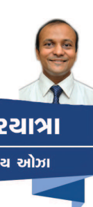
વિચારયાત્રા ડૉ. જય ઝોજા

બે-ત્રણ દિવસમાં જ બચ્ચું જન્મ લેવાનું હોય તે પહેલાં જ તે બકરીને મારીને તેની અંદરથી પેલા અજન્મા બચ્ચાને બહાર કાઢવામાં આવે છે. અને તેને કુટ્ટીપાય કહે છે. તે ખૂબ જ મુલાયમ અને સ્વાદીષ્ટ હોય છે. માટે હું તેને શોધી રહી છું". હવે આ ફૂરતાને આપણે કઈ કલામાં મૂકીશું ? પર્યાવરણ બચાવોની કાગારોળ મચાવતાં આપણે નવી નવી સંસ્થાઓ અને એન.જી.ઓ. બનાવી બનાવીને પર્યાવરણ-પ્રકૃતિને બચાવવાનો ડોળ કરી રહ્યાં છીએ. જ્યારે આ કોરોના સમયમાં પ્રકૃતિએ આપણને લપડાક મારીને સમજાવી દીધું કે, પ્રકૃતિ પોતાનું Healing જાતે જ કરી શકે છે. બસ આપણે આડા ન આવીએ તો. એ લોકડાઉનમાં હવા શુદ્ધ થઈ ગઈ, નદીઓ શુદ્ધ થઈ ગઈ પર કારણકે પ્રકૃતિને બંધાડતાં એવા મનુષ્યો ઘરોમાં બંધાડ હતા. પ્રકૃતિ-પૂજન આપણી સનાતન સંસ્કૃતિનું એક અભિન્ન અંગ છે. શાકાહારી ભોજન જ શરીર માટે આવશ્યક છે, જોઈએ તેટલો જ ખોરાક લેવો તે શરીર અને પ્રકૃતિ બન્ને માટે આવશ્યક છે. આજે વિશ્વમાં માત્ર આપણાં જ દેશમાં એ પણ અમુક વર્ગમાં જ આ ભાવના અને સંસ્કાર બચ્યા છે. મનુષ્યએ પોતાની સ્વાદેન્દ્રિયો અને અન્ય ઈન્દ્રિયોના આનંદ અર્થે જ પ્રકૃતિનો દુરુપયોગ કર્યો છે. અને આનું દુષ્પરિણામ આપણે જોઈ રહ્યા છીએ. પ્રકૃતિએ માણસને જણાવી દીધું છે કે આપણે મનુષ્ય પ્રકૃતિ આગળ કશું જ નથી. માતા ભૂમિ પુત્રોજીવં પૃથિવ્યા : આ પ્રમાણે ભૂમિ સૂક્ત આપણે ત્યાં છે. પશુને બકરી તેના બચ્ચાને જન્મ આપવા માટે સજ્જ હોય છે, અને માત્ર