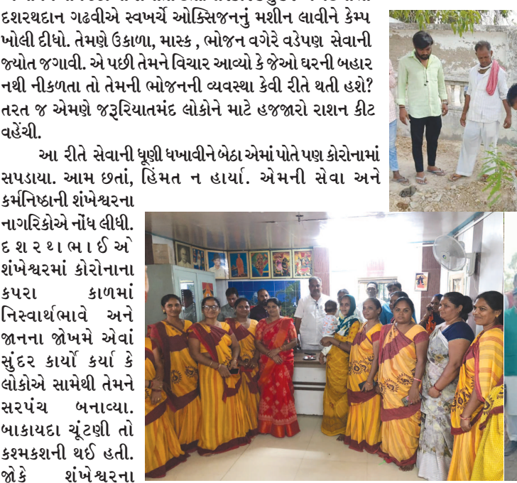
ધણી વાતો કરી.

એક વખત એમના નિવાસસ્થાનની પાણીની મોટર બગડી. એમની જાણ બહાર ગ્રામ પંચાયત તરફથી પાણીનું ટેકર તેમના ઘરે ગયું. સરપંચને જ્યારે આ ખબર પડી ત્યારે તેઓ નારાજ થયા, એટલું જ નહીં તાત્કાલિક પાણીનું ટેકર પાછું મોકલ્યું. પોતે ગામના સરપંચ છે એટલે કોઈ વિશેષ લાભ લેવાનો એવું તેઓ માનતા નથી.