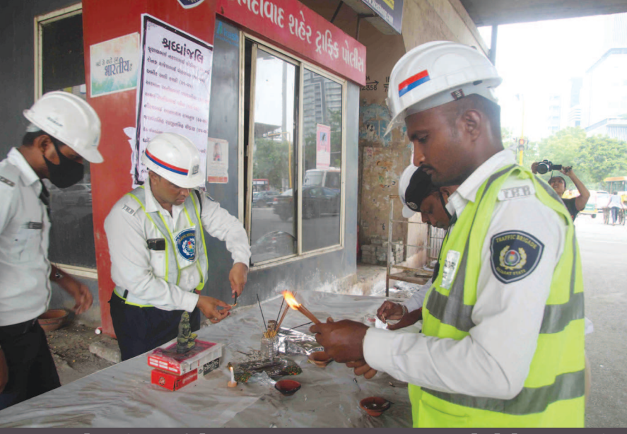
ઈસ્કોન બ્રિજ નીચે અકસ્માતમાં મૃત્યુ પામનાર લોકોને શ્રદ્ધાંજલિ આપવામાં આવી હતી.