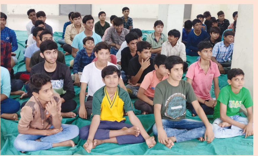
આદર્શ નિવાસી શાળા (અ.જા.કુમાર) સેક્ટર-૮, ગાંધીનગર ખાતે આજ રોજ વિદ્યાર્થીઓના સર્વાંગી વિકાસ તથા ઉચ્ચ સંસ્કાર શિક્ષા કાર્યક્રમ અંતર્ગત યોગ્ય આયોજન શ્રી યોગ વેદાંત સેવા સમિતિ, ગાંધીનગર દ્વારા કરવામાં આવ્યું હતું.