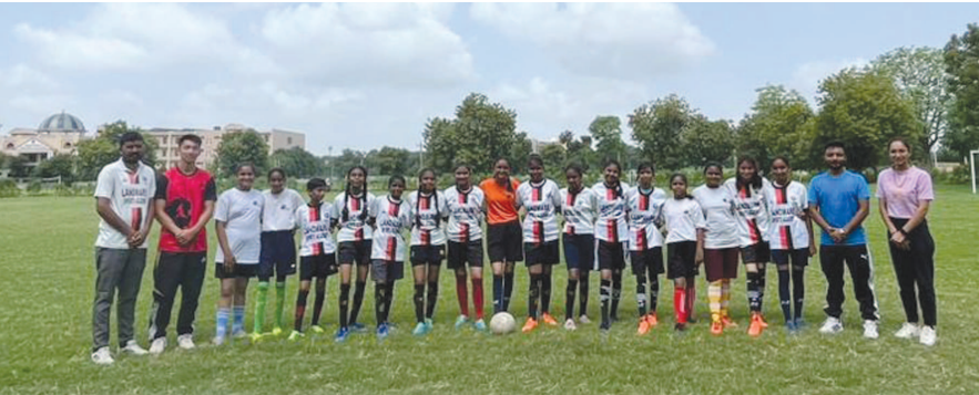
જિલ્લાની ફૂટબોલ ટુર્નામેન્ટની અંદર ઓમ લેન્ડમાર્ક સ્કૂલ ચેમ્પિયન ગુજરાત સરકાર દ્વારા આયોજિત કપ ફૂટબોલ ટુર્નામેન્ટનું આયોજન કરવામાં આવ્યું હતું જેમાં અંડર-૧૭ સ્પર્ધામાં ઓમ લેન્ડમાર્ક સ્કૂલ મેદાન મારી પ્રથમ નંબરે આવી હતી.