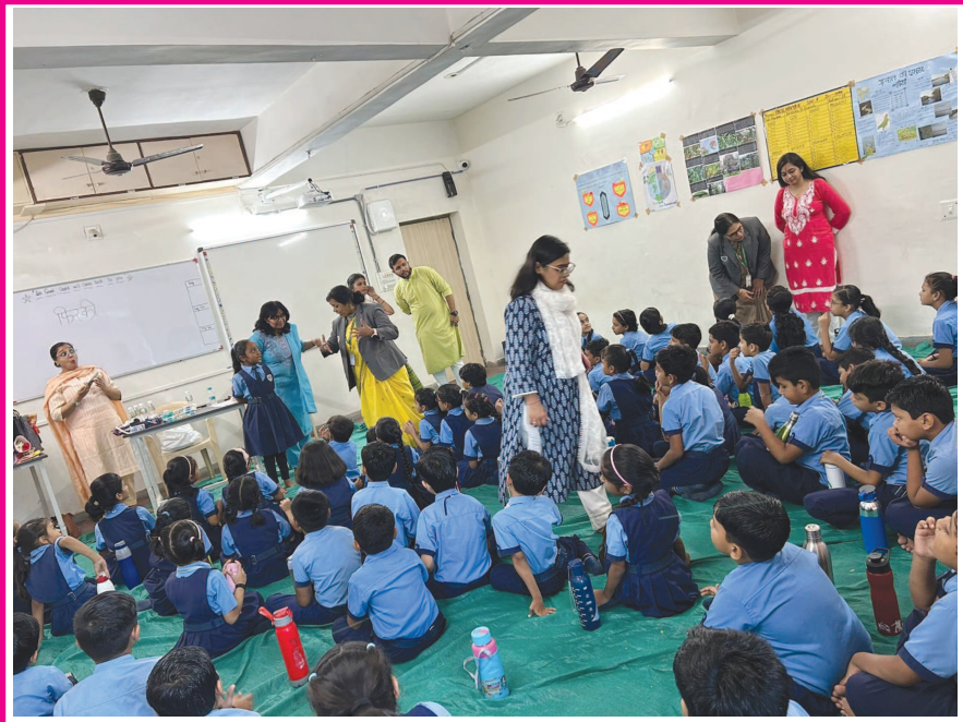
સર્વવિદ્યાલય કેળવણી મંડળ દ્વારા સંચાલિત એસ.વી.અંગ્રેજી માધ્યમ પ્રાથમિક શાળા માં એનસીઈઆટી અને તેની સાથે સંલગ્ન સેન્ટ્રલ યુનિવર્સિટી ઓફ ગુજરાત દ્વારા વર્કશોપનું આયોજન કરવામાં આવ્યું હતું. શાળાના વિદ્યાર્થીઓએ વાર્તાઓ, ચિત્રો અને બીજી અનેક રસપ્રદ સમૂહ પ્રવૃત્તિઓમાં ઉત્સાહપૂર્વક ભાગ લીધો હતો.