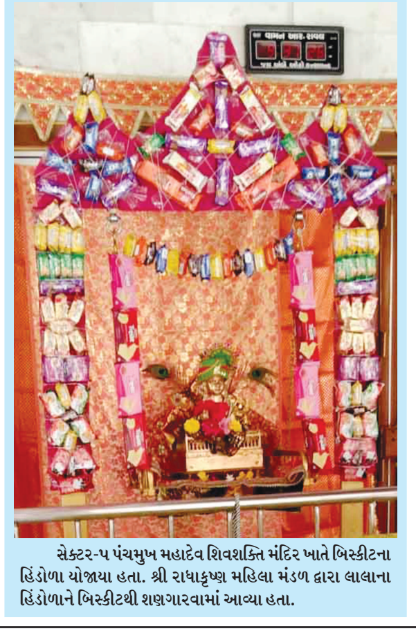
સેક્ટર-૫ પંચમુખ મહાદેવ શિવશક્તિ મંદિર ખાતે બિસ્કીટના હિંડોળા યોજાયા હતા. શ્રી રાધાકૃષ્ણ મહિલા મંડળ દ્વારા લાલાના હિંડોળાને બિસ્કીટથી શણગારવામાં આવ્યા હતા.