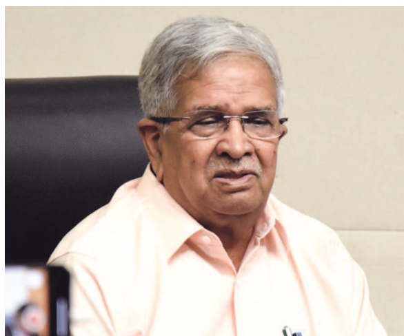
બંનેલા પ્રતિભાશાળી વિદ્યાર્થીને ધોરણ-૮ પછી ૨૦,૦૦૦નું વાર્ષિક અર્પણ.

આગામી વર્ષના બજેટમાં શહેરી વિકાસ માટે નાણાંમંત્રીએ ૧૮,૬૮૫ કરોડ રૂપિયા ફાળવ્યા