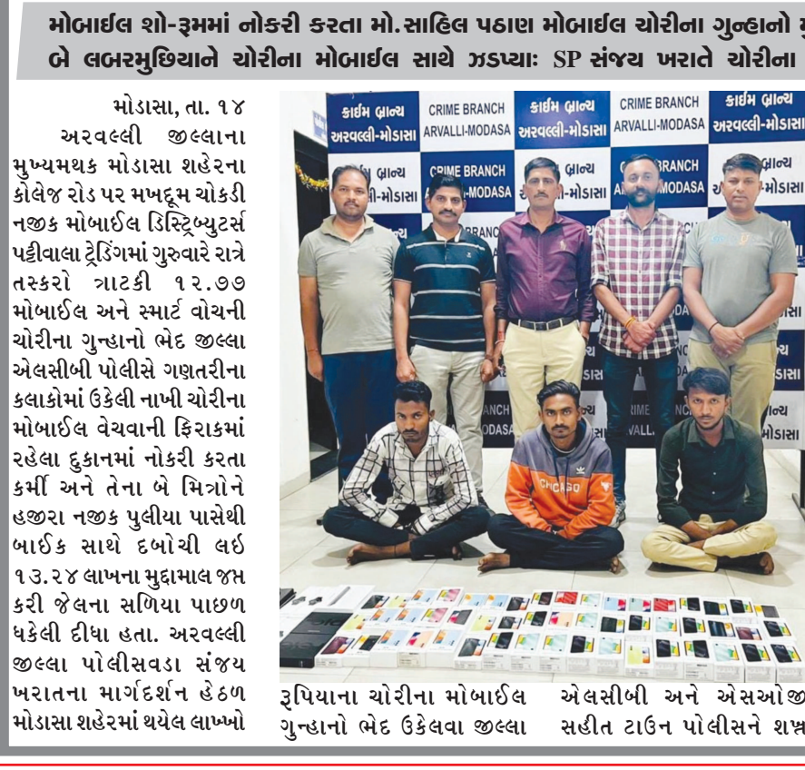
રૂપિયાના ચોરીના મોબાઈલ એલસીબી અને એસઆઈ સહીત ટાઉન પોલીસને શખ ગુન્હાનો ભેદ ઉકેલવા જીલ્લા