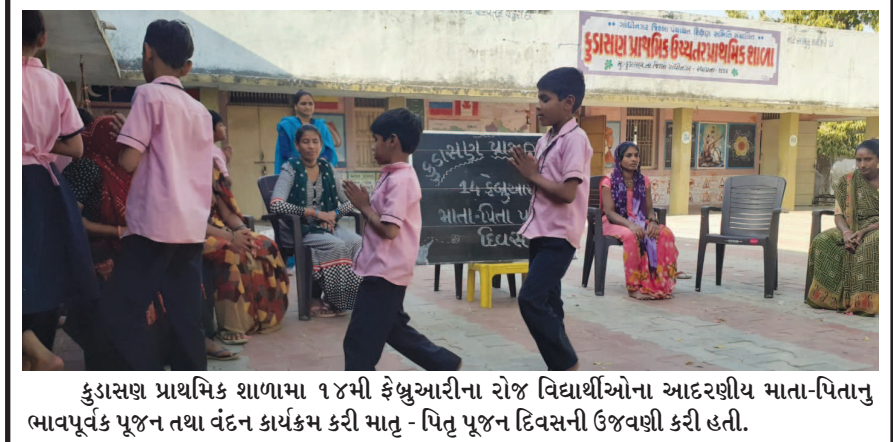
કુડાસણ પ્રાથમિક શાળામાં ૧૪મી ફેબ્રુઆરીના રોજ વિદ્યાર્થીઓના આદરણીય માતા-પિતાનું ભાવપૂર્વક પૂજન તથા વંદન કાર્યક્રમ કરી માતૃ-પિતૃ પૂજન દિવસની ઉજવણી કરી હતી.