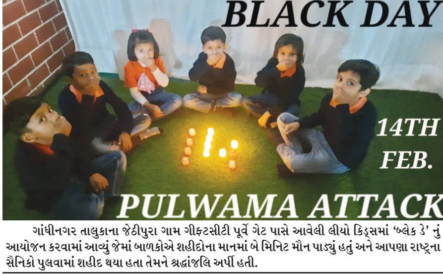
ગાંધીનગર તાલુકાના જેટીપુરા ગામ ગીફ્ટસીટી પૂર્વે ગેટ પાસે આવેલી લીયો કિડ્સમાં 'બ્લેક ડે' નું આયોજન કરવામાં આવ્યું જેમાં બાળકોએ શહીદોના માનમાં બે મિનિટ મૌન પાડ્યું હતું અને આપણા રાષ્ટ્રના સૈનિકો પુલવામાં શહીદ થયા હતા તેમને શ્રદ્ધાંજલિ અર્પી હતી.