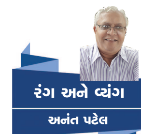
રંગ અને વ્યંગ