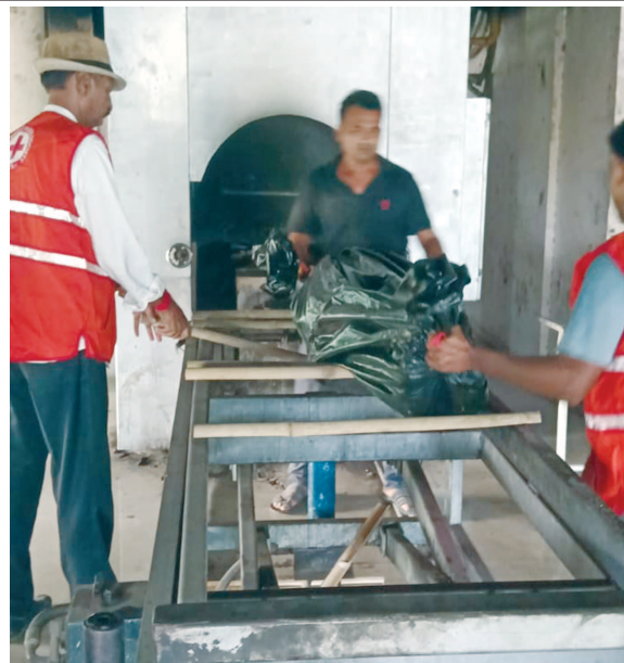
ગાંધીનગર જિલ્લા રેડકોસ દ્વારા બિનવારસીના અગ્નિસંસ્કાર કરવામાં આવ્યા હતા.