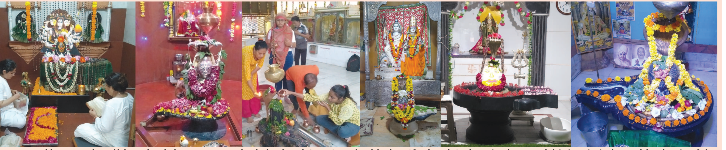
બમ બમ ભોલે... હર હર મહાદેવ... વગેરે જેવા જયઘોષ સાથે પવિત્ર શ્રાવણ માસના પ્રથમ સોમવારે શહેરના શિવાલયો ગુંજી ઉઠ્યાં હતા. શહેરના વિવિધ સેક્ટરમાં સ્થિત શિવાલયોમાં આજે સવારથી જ ભોળાનાથના ભાવિકોની ભીડ ઉમટી હતી અને શ્રદ્ધાળુઓએ મહાદેવજીની જલાભિષેક, દૂધાભિષેક અને પુષ્પાભિષેક કરી પૂજા-અર્ચના કરી હતી.