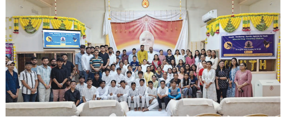
વાગે બ્રહ્માકુમારીઝ, ઉર્જાનગર. ૧, રાંદેસણ, ગાંધીનગર ના હોલમાં 'હેલ્થ વેલ બીઈંગ સ્પોર્ટ્સ: એજન્ડા

ગાંધીનગર, તા. ૨૧ પ્રજાપિતા બ્રહ્માકુમારી ઈશ્વરીય વિશ્વ વિદ્યાલયની ભગિની સંસ્થા રાજ્યયોગ એજ્યુકેશન એન્ડ રિસર્ચ ફાઉન્ડેશનના ૨૦ પ્રભાગ પૈકીના યુવા પ્રભાગ દ્વારા ગ્રૂપ ૨૦ તળેના વાય ૨૦ પ્રોજેક્ટ્સ અંતર્ગત સમગ્ર ભારતભરમાં સંમેલનો, સેમિનાર, અભિયાન, પ્રદર્શન, ટેક શો, વેલનેસ કેકે, વર્કશોપ, ચોપાલ, પીસ વોક જેવા વિભિન્ન કાર્યક્રમોનું આયોજન થયેલ.