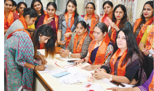
વસ્ત્રાપુર અંધજન મહામંડળના બહેનો દ્વારા વડાપ્રધાન નરેન્દ્ર મોદી અને ગૃહમંત્રી અમિત શાહને રાખડી પોસ્ટ કરવામાં આવી હતી.

નર્મદા, તા. ૨૦ નર્મદા ડેમની જળ સપાટી ૧૨૩ મીટર પર પહોંચી છે. ૩મ મહત્તમ સપાટીથી ૬ મીટર દુર છે. હાલમાં સરદાર સરોવરમાં પાણીનો જથ્થો ૭૭.૮૧ ટકા જેટલો રવિવારે બપોરે બાદ નોંધાયો હતો. નર્મદા ડેમમાં સતત પાણીની આવક નોંધાઈ રહી છે. ગત મધરાત્રી ૨૨મિયાન પાણીની આવક ૧ લાખ ક્યુસેક કરતા વધુ થઈ રહી હતી. જે દિવસે એકદરે ૮૦ હજાર ક્યુસેકની આસપાસ રહી હતી. જોકે બપોરે ૧૨ કલાકે આવક ફરીથી ૧ લાખ ક્યુસેક કરતા વધારે નોંધાઈ હતી. ઉપરવાસમાં વરસાદને પગલે નર્મદા ડેમમાં પાણીની આવકમાં વધારો થયો હતો. નદીમાં ૪૪ હજાર ક્યુસેક પાણી છોડવામાં આવી રહ્યું છે. ડેમમાં પાણીની આવક થવાને લઈ વીજ ઉત્પાદન શરૂ થઈ ચુક્યું છે. નર્મદા ડેમ પર આવેલ RBPH ના ૬ ટર્બાઈન અને CHPH ૩ ટર્બાઈન શરૂ કરવામાં આવ્યા છે. આમ ડેમમાં પાણીની આવક થતા વીજ ઉત્પાદન ૯ થવા લાગ્યું છે. નર્મદા ડેમની સપાટી હવે ૮૦ ટકાએ પહોંચવા તરફ આગળ વધી રહી છે. ડેમમાં જળ જથ્થાને લઈ મોટી રાહત સર્જાઈ છે.