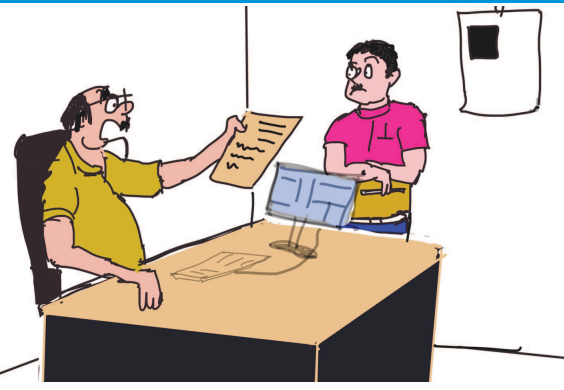
ભારત પાકિસ્તાની મેચનાં દિવસે રજાની અરજી અત્યાર થી....!!