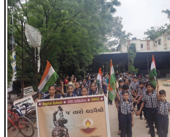
આજ રોજ સ્વામી વિવેકાનંદ પબ્લિક સ્કૂલ સેક્ટર-૨૪ ખાતે "આઝાદી કા અમૃત મહોત્સવ" નાં ઉજવણી નાં ભાગરૂપે મેરી માટી મેરા દેશ નાં અભિયાન હેઠળ રેલીનું આયોજન કરવામાં આવ્યું હતું જેમાં શાળાના બાળકોએ ઉત્સાહ ભરે ભાગ લીધો હતો.. તિરંગા અને વિવિધ નારા સાથે રેલી યોજવામાં આવી હતી..