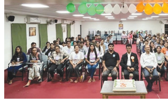
સર્વ નેતૃત્વની તાલીમ શિબિરમાં આયોજન નિયમિત રીતે કરવામાં આવે છે. જેમાં સર્વ વિદ્યાલય કડી અને ગાંધીનગરની ૧૯ કોલેજના ૨૦૦૦૦ વિદ્યાર્થીઓ પૈકી ૭૫ વિદ્યાર્થીઓને પ્રવેશ આપવામાં આવે છે.

વૃદ્ધાશ્રમના વડીલોને સ્ટ્રેચ્યુ ઓફ યુનિટી, હરસિદ્ધ માતાનું મંદિર અને પોઈટા પ્લાટે હર્ષ અને આનંદનો પ્રવાસ કરાવ્યો હતો. આ પ્રવાસ દરમિયાન સર્વ વિદ્યાલયના યુવાનો દ્વારા બૂબ જીવણટભરી અને કાળજીપૂર્વકની કામગીરી કરવામાં આવી હતી.