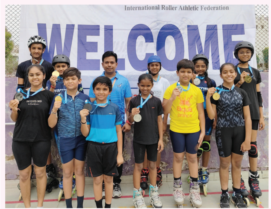
તાજેતરમાં અમદાવાદ મુકામે રાજ્યકક્ષાની રોલર એથલેટિક્સ ની સ્પર્ધા યોજાઈ ગઈ. જેમાં અલગ અલગ જિલ્લાના ૪૦૦ થી પણ વધારે ખેલાડીઓએ ભાગ લીધેલ. આસ્પર્ધામાં ૬ વર્ષથી નીચેના બાળકોથી લઈને ૧૭ વર્ષથી નીચેના બાળકોની સ્પર્ધા યોજવામાં આવી હતી. આ સ્પર્ધામાં ઈનલાઈન સ્કેટ, કોડ સ્કેટ અને ટેનાસીટી સ્કેટની સ્પર્ધા અલગ અલગ વય જૂથ પ્રમાણે યોજવામાં આવેલ હતી. ભાઈઓ અને બહેનોની સ્પર્ધા અલગ અલગ કરવામાં આવેલ હતી. આ સ્પર્ધામાં ભાગલે સ્ટેડિંગ ટીમના ખેલાડીઓએ ખૂબ જ મહેનત કરી હતી તેનું પરિણામ તેમને આ સ્પર્ધામાં નંબર લાવીને મેળવેલ છે. જેઓના નામ નીચે મુજબ આપેલ છે.

ગાંધીનગર, તા.૭ હાલમાં ચોમાસાની સિઝનમાં મચ્છરજન્ય રોગચાળો વકરતો જોવા મળે છે. શહેરમાં ઘરે ઘરે બિમારીના પાટલા જોવા મળી રહ્યા છે. ત્યારે શહેરની સિવિલમાં તાવ, ઝાડા-ઉલ્ટી, મેલેરીયા, ટાઈફોઈડ, કમળો સહિત ૩૨૦૦૫ના કેસ વધુ જોવા મળી રહ્યા છે. સિવિલ હોસ્પિટલમાં ગત સપ્તાહે ૧૬૮ કેસ ૩૨૦૦૫ અને ૮ ટાઈફોઈડના નોંધાયા હતા. ત્યારે શહેરને મચ્છરજન્ય રોગચાળો ધીમેધીમે અજગરી ભરડો લઈ રહ્યો હોય તેમ લાગી રહ્યું છે. ત્યારે આરોગ્ય વિભાગ દ્વારા પણ મચ્છરજન્ય રોગચાળાને કાબુમાં કરવા કવાયત હાથ ધરવામાં આવી છે. ગાંધીનગર શહેરમાં રોગચાળાની સિઝન ચાલી રહી છે. નાગરીકો વાઈરલ બિમારીનો ભોગ બની રહ્યા છે. એક ઘરમાં એક થી સભ્યો મચ્છરજન્ય કે પાણીજન્ય રોગચાળાનો ભોગ બનેલા છે. શહેરની સિવિલ સહિત ખાનગી દવાખાનામાં પણ દર્દીઓની લાંબી લાઈનો જોવા મળી રહી છે. ત્યારે ચોમાસાની સિઝનમાં ઠેકઠાકણે વરસાદી પાણી ભરાવાની સાથે કાબા, અગાસી, ઠુલ છોડ, કુલર, ફીજ, કુંડા, સહિતના પાત્રમાં પાણી ભરાવાને પગલે મચ્છરોનું ઉત્પત્તિ સ્થાન થઈ જાય છે. મચ્છરોના પગલે આસપાસના વિસ્તારમાં મચ્છરજન્ય રોગચાળો વકરે છે. જ્યારે ચોખ્ખા પાણીમાં ૩૨૦૦૫ના મચ્છરો ઉત્પન્ન થતા હોવાથી ૩૨૦૦૫ રોગચાળો વધુ વકરે છે. શહેરમાં ૩૨૦૦૫ અજગરી ભરડો લઈ રહ્યો હોય તેમ લાગી રહ્યું છે. તાજેતરમાં સિવિલમાં જ ભાવિ તબિબો અને સ્ટાફના કર્મચારીઓ પણ ૩૨૦૦૫માં સપડાયા હતા. ત્યારે ગત સપ્તાહે સિવિલમાં ૩૨૦૦૫ના ૧૬૮ કેસ સામે આવ્યા હતા. જ્યારે ટાઈફોઈડના પણ ૮ કેસ નોંધાયા હતા. ત્યારે તંત્ર દ્વારા મચ્છરજન્ય રોગચાળો અટકાવવા માટે ફોંબીંગ અને દવા ઉત્કટકાવી કામગીરી શરૂ કરી છે.