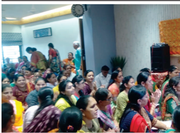
સહજાનંદ સીટી, કુડાસણ ખાતે આનંદનો ગરબો યોજાયો હતો જેમાં મોટી સંખ્યામાં મહિલાઓ ઉપસ્થિત રહી માતાજીના ગરબા નો લાભ લીધો હતો.

સસલાંથી માંડીને ક્યારેક દીપસાં જેવા વન્ય પ્રાણીઓ તેમજ અજગર, નાગ, કાળોતરા, ખડગીતરા સહિતના સરીસૃપો વગેરે વન અધિનિયમ હેઠળ આરક્ષિત પ્રાણી-પક્ષીઓ જેવાં દુર્લભ વન્યજીવો મુક્ત પણ વિચરે છે. પાટનગરના વિસ્તરણ, ઝડપથી વધી રહેલો માનવ વસવાટ જેને કારણે વધી રહેલો વાહનવ્યવહાર અને અનેકવિધ પ્રકારના વિકાસ કાર્યોને પગલે વધી રહેલાં કોંક્રીટના જંગલ સાથે સતત બચાવકાર્યની સેવા પુરી પાડવામાં આવે છે પરંતુ ગાંધીનગરમાં વાઈલ્ડલાઈફ કેર સેન્ટરના અભાવે ઘણીવાર આ વન્યજીવોને બચાવવા મુશ્કેલ બને છે તેથી સંસ્થા દ્વારા આજે રાજ્યના કેબિનેટ વનમંત્રી મુળભાઈ બેરા અને રાજ્યકક્ષાના વનમંત્રી મુકેશભાઈ પટેલને આવેદન પત્ર આપવામાં આવ્યું હતું જેમાં સત્વરે ગાંધીનગરમાં અદ્યતન વન્યજીવ સારવાર કેન્દ્ર વિકસાવવા માંગ કરવામાં આવી છે. અત્રે