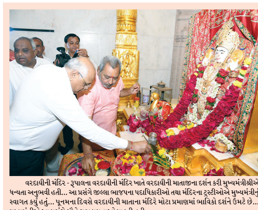
વરદાયીની મંદિર - રૂપાલના વરદાયીની મંદિર ખાતે વરદાયીની માતાજીના દર્શન કરી મુખ્યમંત્રીશ્રીએ ધન્યાના અનુભવી હતી... આ પ્રસંગે જીલ્લા ભાજપના પદાધિકારીઓ તથા મંદિરના ટ્રસ્ટીઓએ મુખ્યમંત્રીનું સ્વાગત કર્યું હતું... પૂનમના દિવસે વરદાયીની માતાના મંદિરે મોટા પ્રમાણમાં ભાવિકો દર્શન ઉમટે છે... મુખ્યમંત્રીએ આ પ્રસંગે સૌને શુભકામનાઓ પાઠવી હતી...

અધ્યાક્ષી અધિકારીએ સભાનું રોજકામ કરી અને તાલુકા વિકાસ અધિકારીને આગળની કાર્યવાહી માટેનો અહેવાલ આપ્યો હોવાનું જાણવા મળેલ છે.