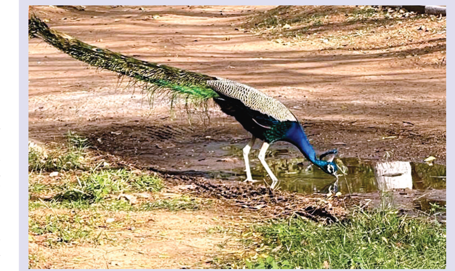
ઉપરાષ્ટ્રપરી સાવકાના માર પછી ઉનાળાની ઋતુએ હવે ધીમે ધીમે પોતાનો આકરો મિજાજ દેખાડવાનું શરૂ કર્યું છે જેની પહેલી અસર પશીઓને વર્તાય છે કેમકે જેમ જેમ તડકાનો તાપ વધતો જાય તેમ તેમ નાના મોટાં ખાઓવીયાં કે પાઈપલાઈનના લિકેજથી સર્જતા પાણીના ભરાવા સુકાવા લાગે જેના કારણે માનવ વસાહત સાથે રહેતાં પંખીઓને તેમની તરસ છીપાવવા આમતેમ ભટકાવાના વારા આવે છે. તસવીરમાં દ્રખ્યાન જાજરમાન રાષ્ટ્રીય પક્ષી મોર પણ કોઈક લીકેજના પાણીને શોષીને પોતાની તરસ છીપાવતો નજરે ચઢે છે. જો કે હજુ ઉનાળો તેના મધ્યાહને પહોંચ્યો નથી, તેમ થશે પછી તો મોરને આ પ્રકારના જાણસોત શોષવા પણ ખૂબ અઘરું બનશે, માટે શહેરજનોએ કડુણા દાખવી તેમની આસપાસ રહેતાં અને કિલકિલાટ કરીને શહેરજનોના મનને પ્રસન્ન કરતાં તથા જોખમી કિટકોને આરોગી જેઈને નાગરિકોના સ્વાસ્થ્યની જાળવણીમાં મદદરૂપ થતાં આ "નિઃસ્વાર્થ મિત્રો" માટે પાણીના કુંડા લગાડી તેમની તરસ છીપાવવામાં મદદરૂપ થવાની ફરજ ના ચુકવી જોઈએ

ડાઈવર્ઝન અન્યથે આર.બી.એલ કંપનીના ટ્રાફિક એન્જિનિયર તથા ટ્રાફિક માશલાનાઓએ રાત્રિના સમયે હાજર રહી ટ્રાફિક નિયમન માર્ગદર્શન કરવાનું રહેશે. જેથી ટ્રાફિકની કોઈ સમસ્યા ન સર્જાય