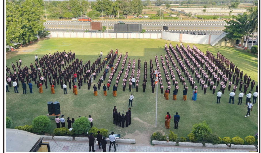
ચૈત્ર સુદ પૂનમના રોજ તા: ૦૬/૦૪/૨૩ ના દિવસે ઓમ લેન્ડ માર્ક સ્કૂલમાં હનુમાન જયંતીની ઉજવણી કરવામાં આવી, જેમાં વિદ્યાર્થીઓ દ્વારા હનુમાન ચાલીલા, રામધૂનનું પઠન તેમજ હનુમાનજી નો મહિમા અને જીવન ચરિત્ર વિશે મહાવિ આપી હતી. જેમાં હર્ષોલ્લાસ સાથે ઓમ લેન્ડ માર્ક પરિવારે ભાગ લીધો હતો.