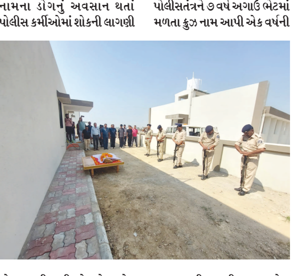
જોવા મળી રહી છે. લેખાડોર સહન તાલીમ પછી જીલ્લા ડોગ પ્રજાતિનો મેલ ડોગ જીલ્લા સ્કવોડમાં સમાવવામાં આવ્યું હતું.

મોડાસા, તા. ૩ અરવલ્લી પોલીસના ડોગ સ્કવોડ વિભાગના ડોગ કુઝનું ટૂંકી બીમારી પછી અવસાન થતા શોકની લાગણી છવાઈ હતી ૭ વર્ષથી જીલ્લા પોલીસતંત્રનો ગુન્હાના ભેદ ઉકેલવામાં સારથી તરીકે ફરજ બજાવતો હતો. કુઝ નામના ડોગે અત્યાર સુધીમાં જીલ્લામાં બનેલ ચોરી, લૂંટ સહિતના અનેક ગુનાઓમાં સરાહનીય કામગીરી કરી હતી. જેને લઈને પોલીસ કુઝ નામના ડોગની કામગીરી ક્યારેક ભૂલી શકશે નહિ. પોલીસ જવાનોએ કુઝના મૃતદેહને ગાર્ડ ઓફ ઓનર આપી અંતિમ વિધિ કરી હતી.